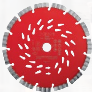
Disques diamant SPX