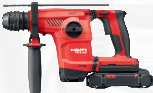
TE 6-22 perforateur