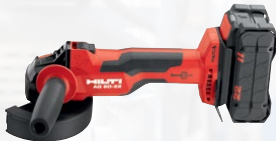
AG 6D-22 meuleuse