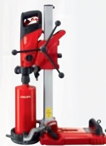
DD 150-U carotteuse