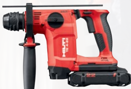
TE 4-22 perforateur