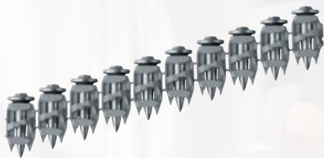
Clous BX 4