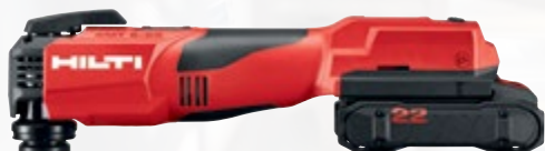
SMT 6-22 multitool