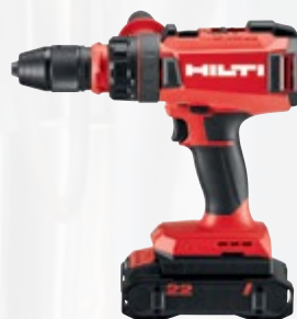
TE 30-22 perforateur-burineur