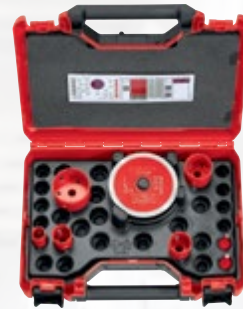
Mèches et lames pour carrelage