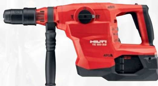
TE 60-22 perforateur-burineur