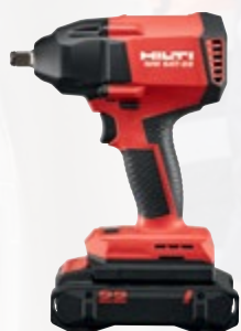
SIW 6AT-22 boulonneuse à chocs