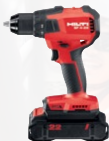
SF 4-22 visseuse