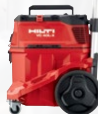
VC 40L-X aspirateur