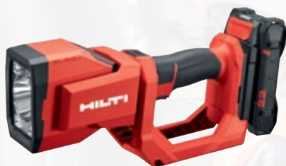
SL 4-22 projecteur