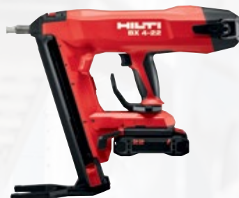
BX 4-22 cloueur