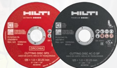
Disques à tronçonner (métal)