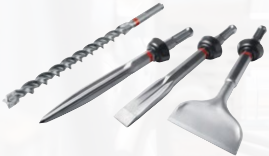
TE-CX/YX mèches et burins